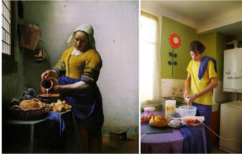
La lechera, de Johannes Vermeer