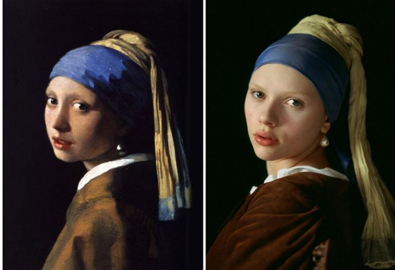
Johannes Vermeer, 1665-1667

Colegio Ciudad Educativa Educación parvularia, básica y media RBD 18028-9 Camino a Las Mariposas N° 4109 Fono: +56 9 961 920 32 Chillán