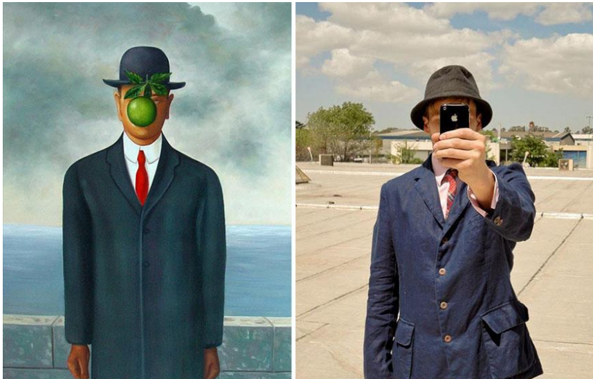
Hijo del hombre, de René Magritte