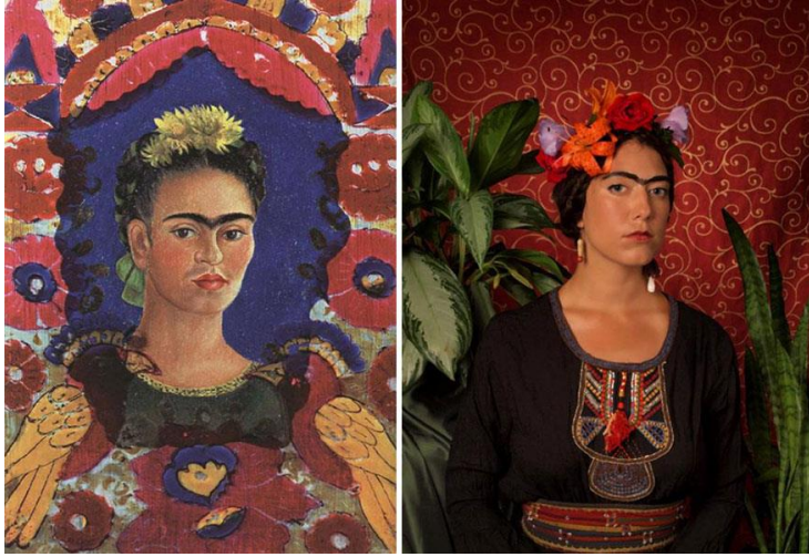
Autorretrato, de Frida Kahlo

Colegio Ciudad Educativa Educación parvularia, básica y media RBD 18028-9 Camino a Las Mariposas N° 4109 Fono: +56 9 961 920 32 Chillán