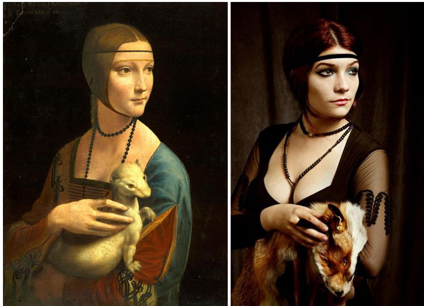
La dama del armiño, de Leonardo da Vinci