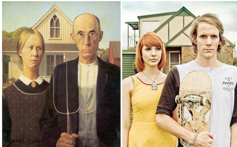
American Gothic, de Grant Wood