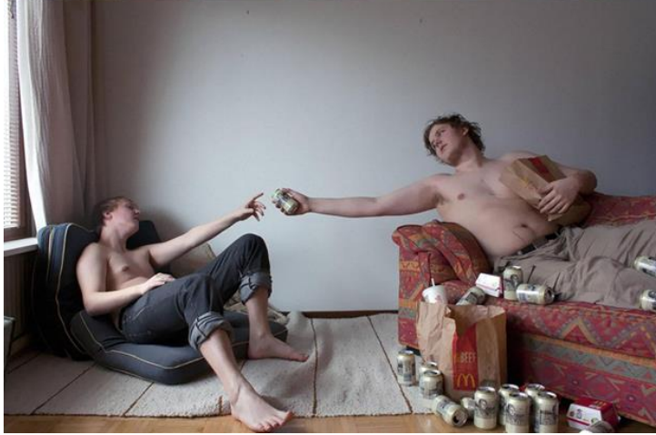
La Creación de Adán, de Miguel Ángel