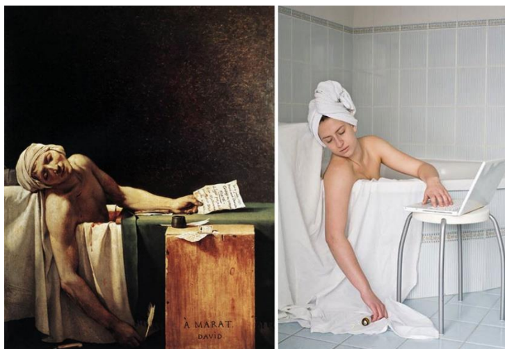
La muerte de Marat, de Jacques Louis David