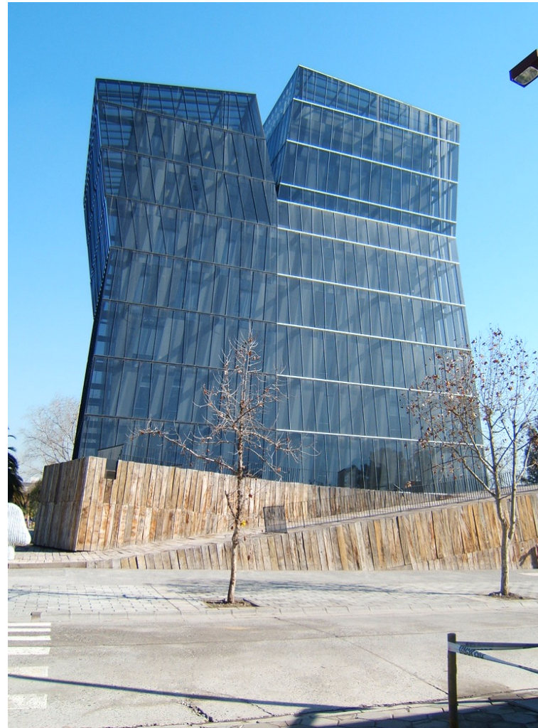
Torres Siamésas (Universidad Católica de Chile)

No obstante, sus obras más destacadas son sus proyectos de VIVIENDAS SOCIALES