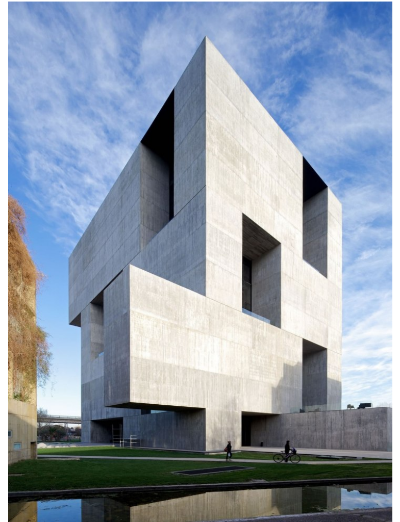
Centro de Innovación Universidad Católica de Chile