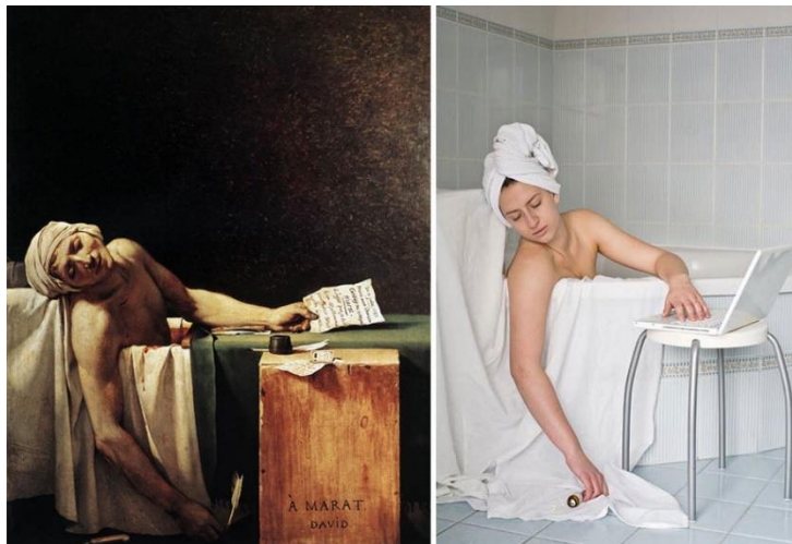
La muerte de Marat, de Jacques Louis David