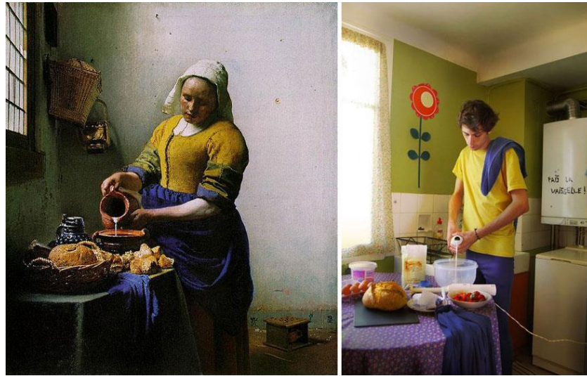
La lechera, de Johannes Vermeer