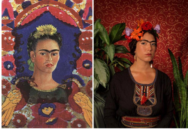
Autorretrato, de Frida Kahlo

Colegio Ciudad Educativa Educación parvularia, básica y media RBD 18028-9 Camino a Las Mariposas N° 4109 Fono: +56 9 961 920 32 Chillán