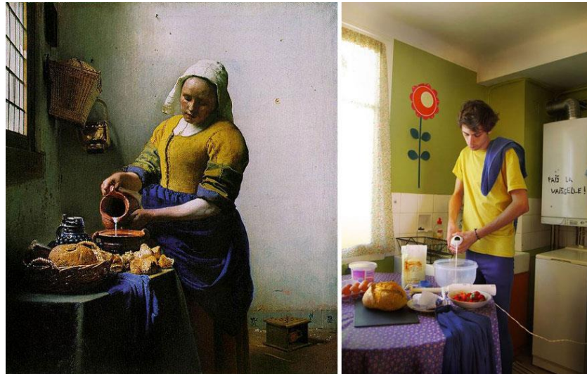
La lechera, de Johannes Vermeer