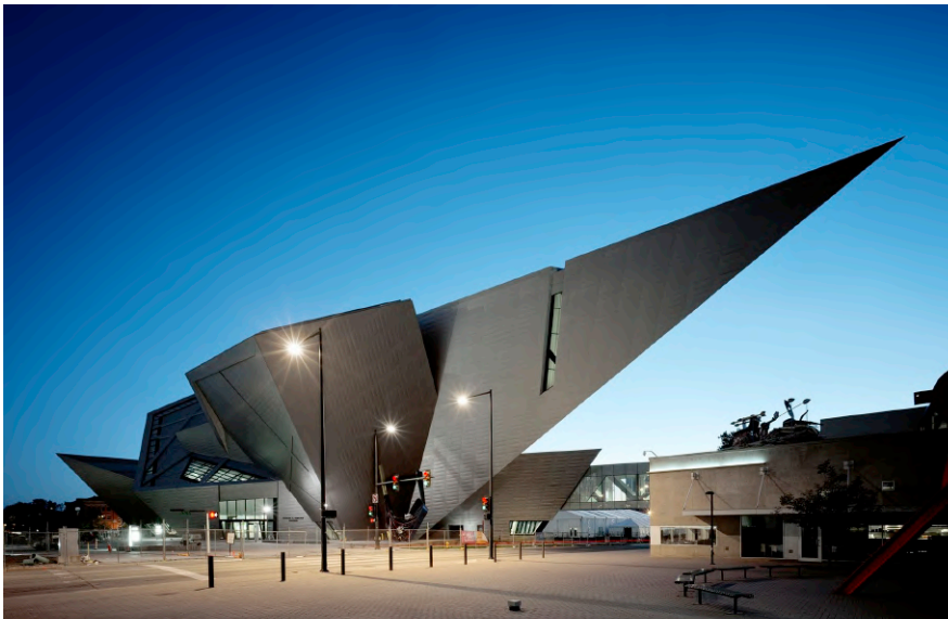
Museo de Arte de Denver (Estados Unidos)