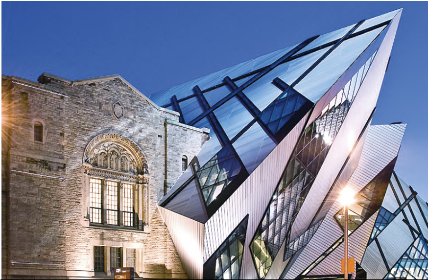
Museo Real de Ontario (Canadá)