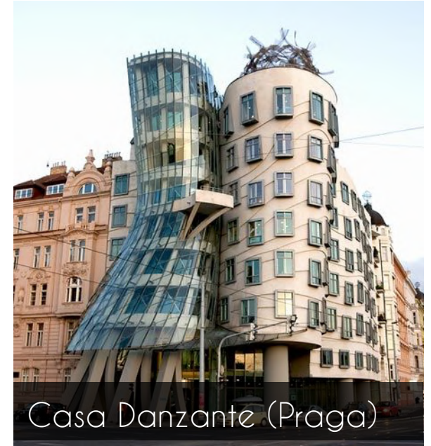
Casa Danzante (Praga)