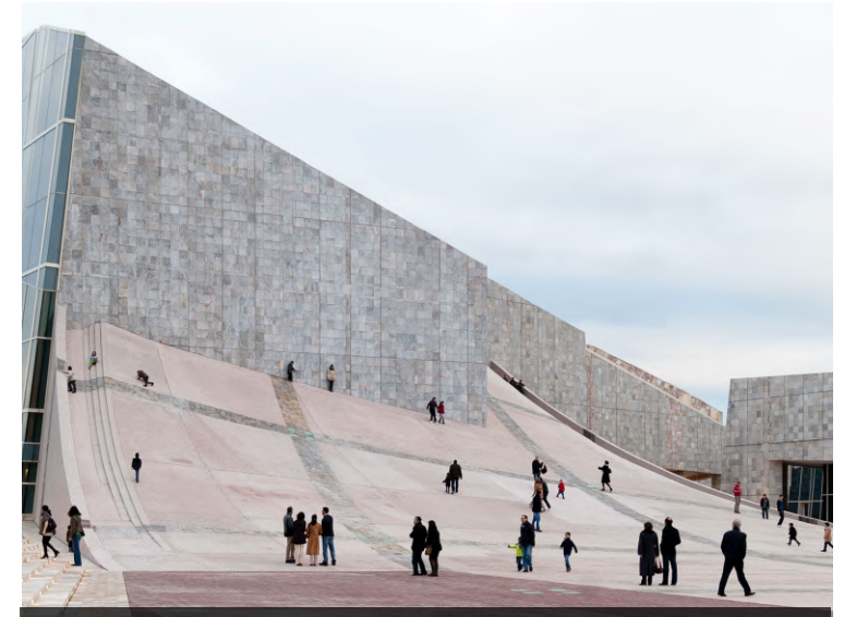
Ciudad de la Cultura de Galicia (España)