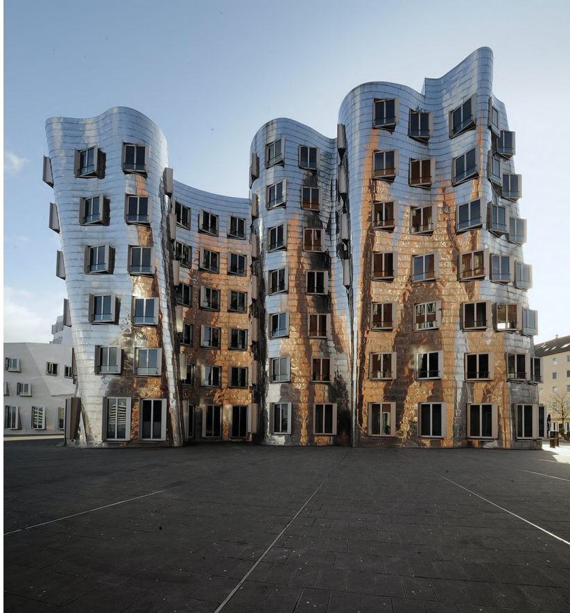
Uso de ondas y curvas