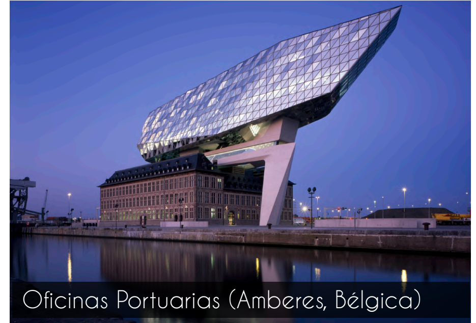
Oficinas Portuarias (Amberes, Bélgica)