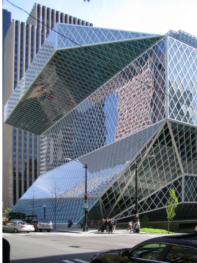
Yuxtaposición (sobreponer formas por sobre otras)