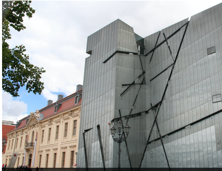
Museo Judío de Berlín (Alemania)