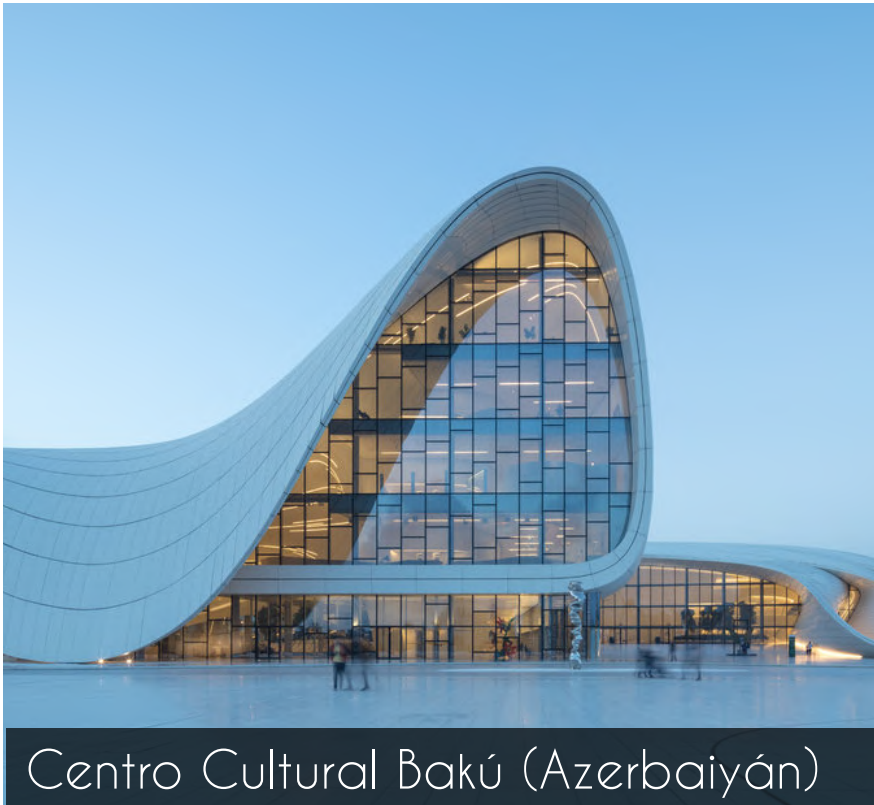
Centro Cultural Bakú (Azerbaiyán)