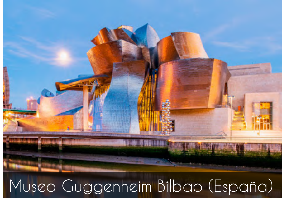
Museo Guggenheim Bilbao (España)