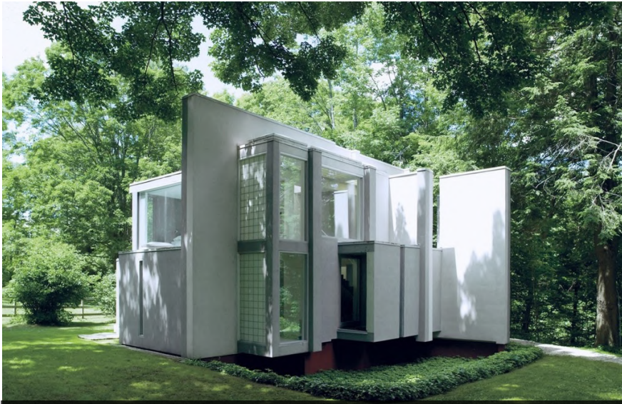
Casa VI (Conneticut, Estados Unidos)