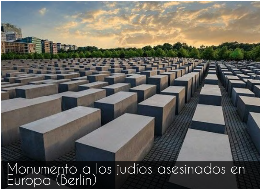
Monumento a los judíos asesinados en Europa (Berlín)