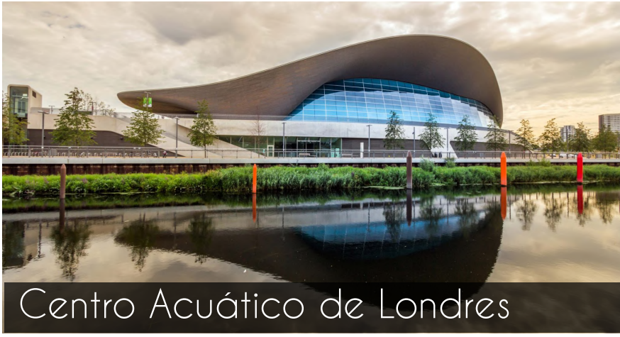
Centro Acuático de Londres