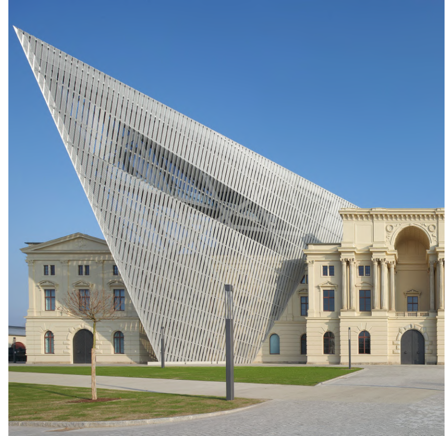
Uso de puntas y formas triangulares