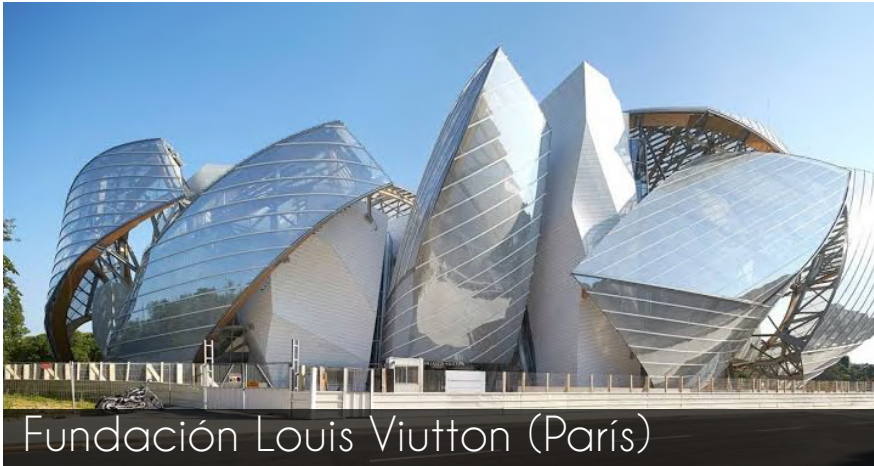
Fundación Louis Vuitton (París)