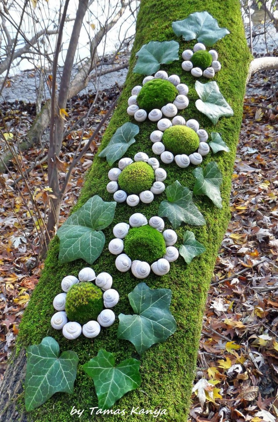
by Tamas Kanya