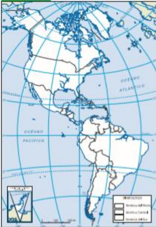
Mapa de América

Comenzar información geográfica. Considerando la información de esta página, realiza la actividad.