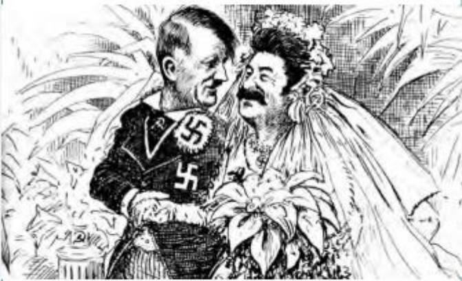
Berryman, C. (1939). ¿Cuánto durará la luna de miel? (Probablemente publicada en el Washington Star ). (S. L.)

La siguiente caricatura muestra lo que se preguntaba un diario norteamericano tras la firma del pacto de no agresión entre Alemania y la Unión Soviética.