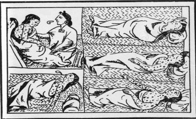
Ilustración que representa la epidemia de viruela en la población indígena. En Sahagún, Bernardino de (Siglo XVI). Historia general de las cosas de Nueva España.

Actividad 3: Observa la imagen, analízala y luego lee el texto adjunto para responder la pregunta que sigue a continuación.