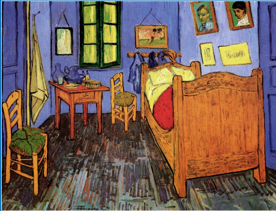
"El dormitorio en Arlés"