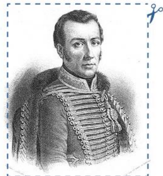
José Miguel Carrera